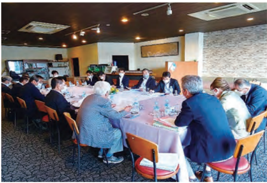
* 組織委員会 10月13日 (火)