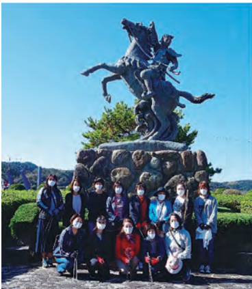
* ボランティアウォーキング 10月23日 (金)