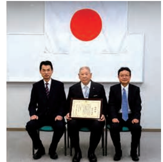
令和2年度 納税表彰受彰者