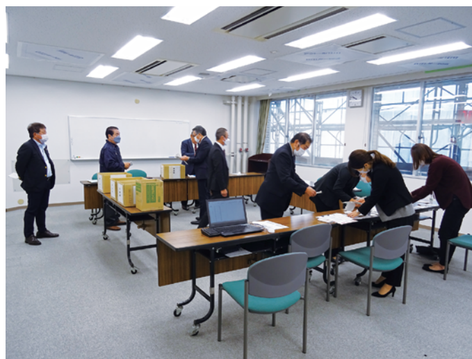
税金クイズ抽選会の様子 11月28日(日)