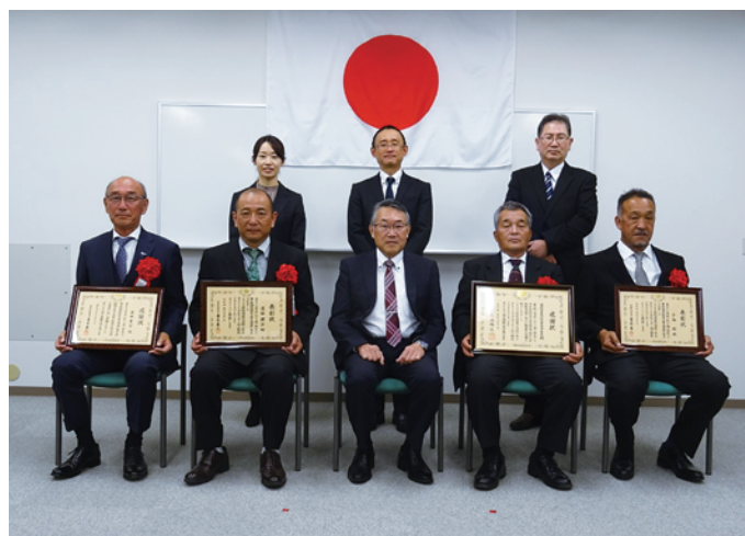
令和4年度 納税表彰受彰者