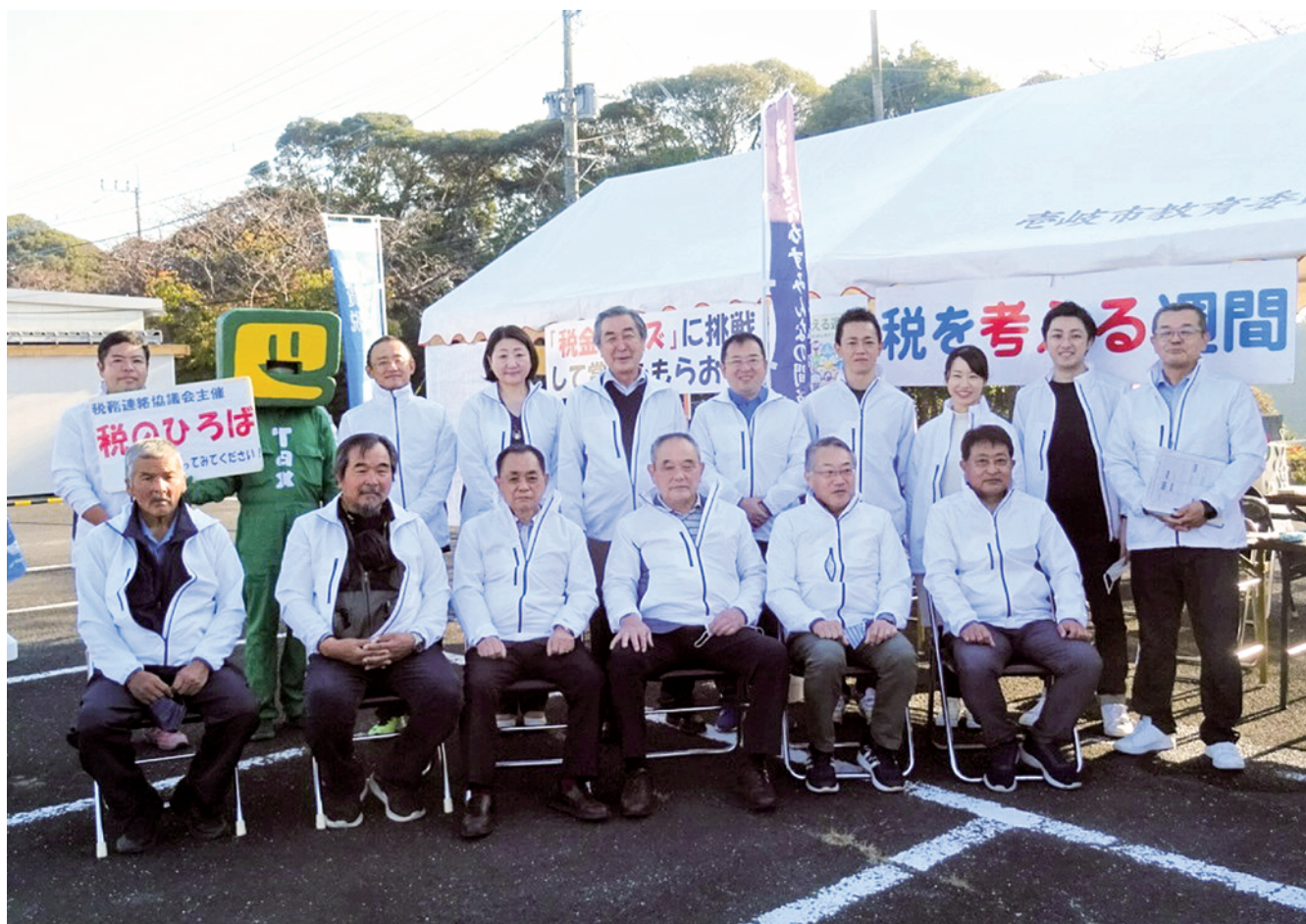
3年振りに開催された『税のひろば』ブース前にて