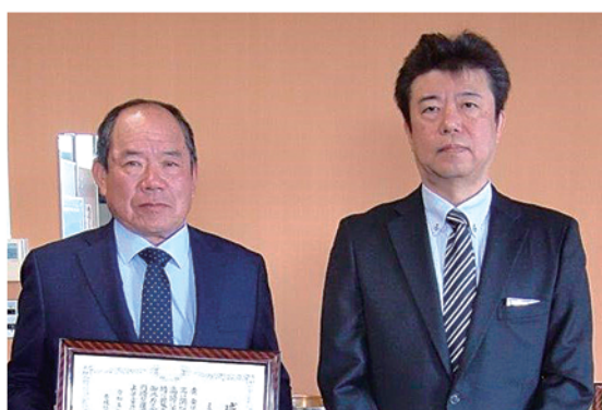
税務署長感謝状受贈者 JA吉岐市青色申告会 様