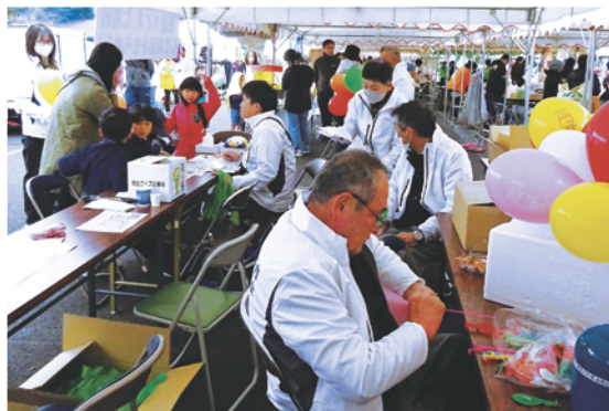
賑わいを見せていた会場の様子