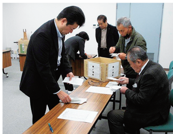
税務連絡協議会役員による抽選会の様子

コロナ禍依頼、昨年に続きJA吉岐市・JAフェスタの会場(11月11日・12日)にて「税のひろば・税金クイズ」を開催。多数の来場者の方に声をかけ2,000通余りのご応募を頂きました。 11月28日・吉岐税務署会議室において200名の当選者を抽選し、それぞれに商品券を送付しました。